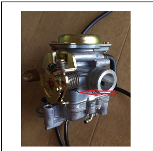
基準不適合発生箇所